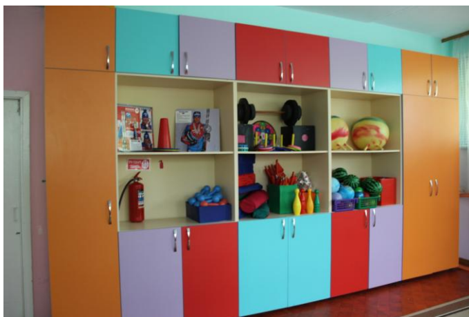
Перечень спортивного оборудования и инвентаря